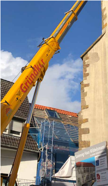
▲ Haus Wibbelmann hat rechtzeitig zum Herbst sein Dach bekommen. Zwei Dachflächenfenster bringen Licht in das Haus.