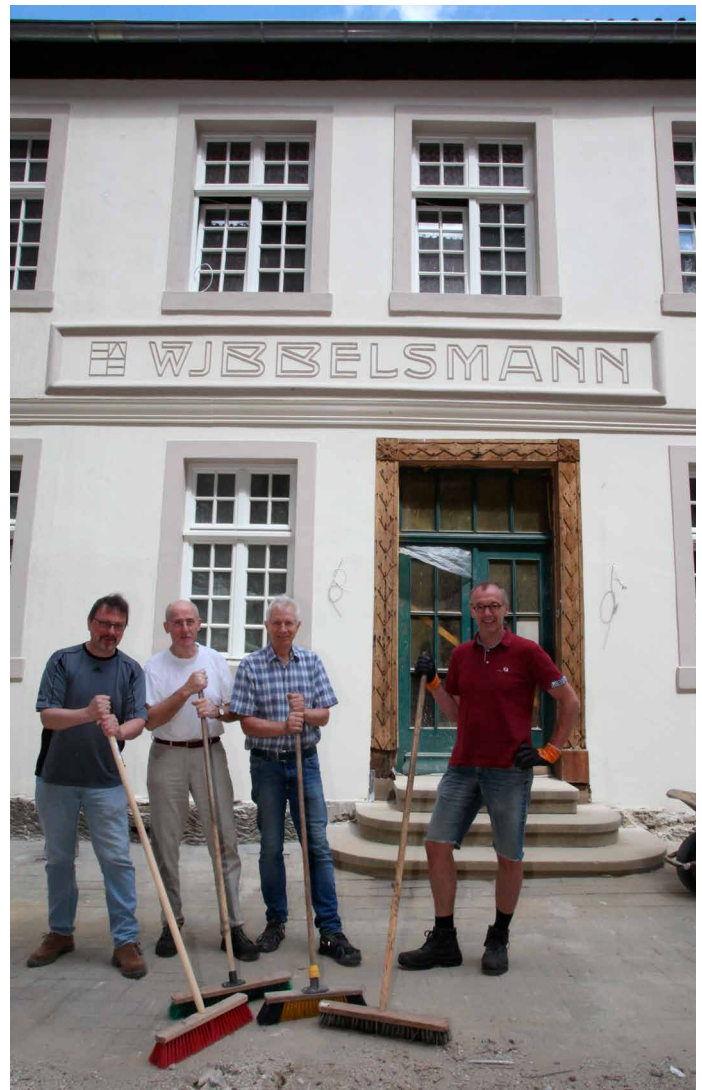
Erste Straßenreinigung nach dem Gerüstabbau ►