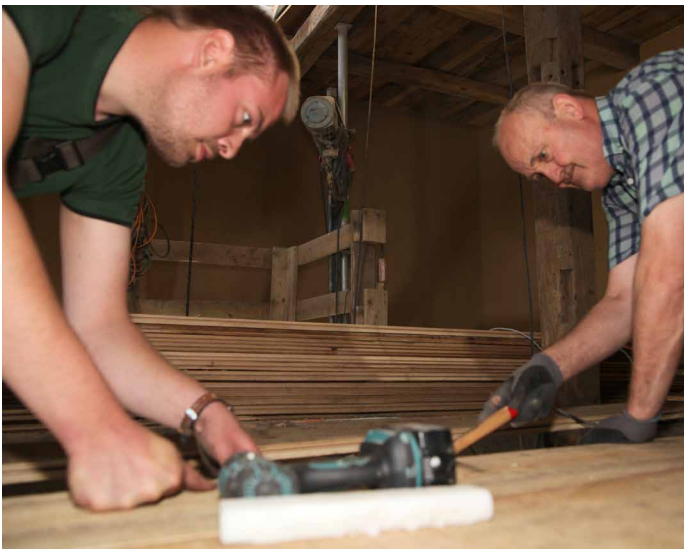
▲ Die Fußbodenbretter sind fachgerecht von der Fußbodendiele Ahmann eingebaut worden. In der Fläche macht der Boden einen stimmigen Eindruck.